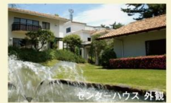
センターハウス 外観