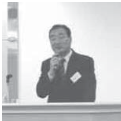
渡部統括官様研修会風景