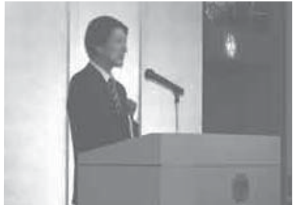
ご挨拶の下城墨田都税事務所長殿