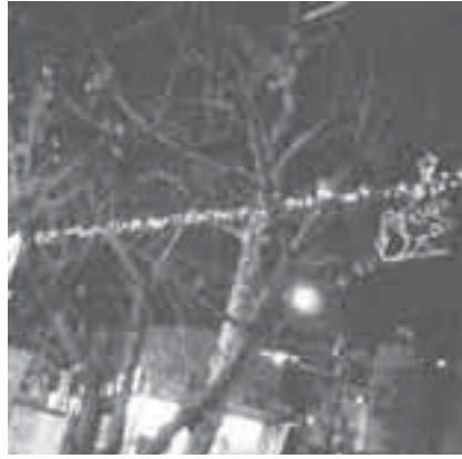
イルミネーション風景