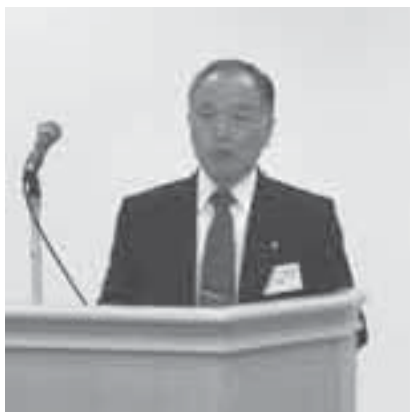
富張税研部会長ご挨拶

また、倭文副署長様のご挨拶では、顧問税理士さんによるe-Tax代理送信、国税のダイレクト納付などe-Taxの利便性、メリットについてお話をいただき『e-Taxがますます使いやすくなりましたので、法人会会員の皆様には積極的に利用をしてほしい』とのお話をいただきました。