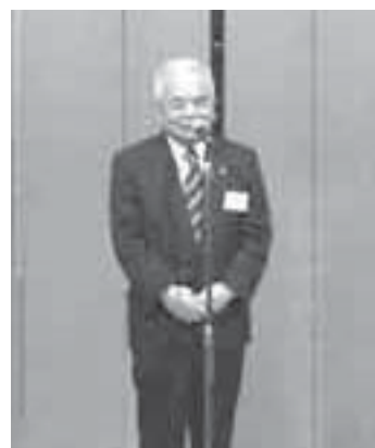
立岡会長様ご挨拶