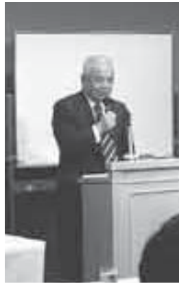
ご挨拶の立岡会長