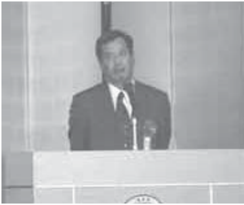
ご挨拶の市川署長殿