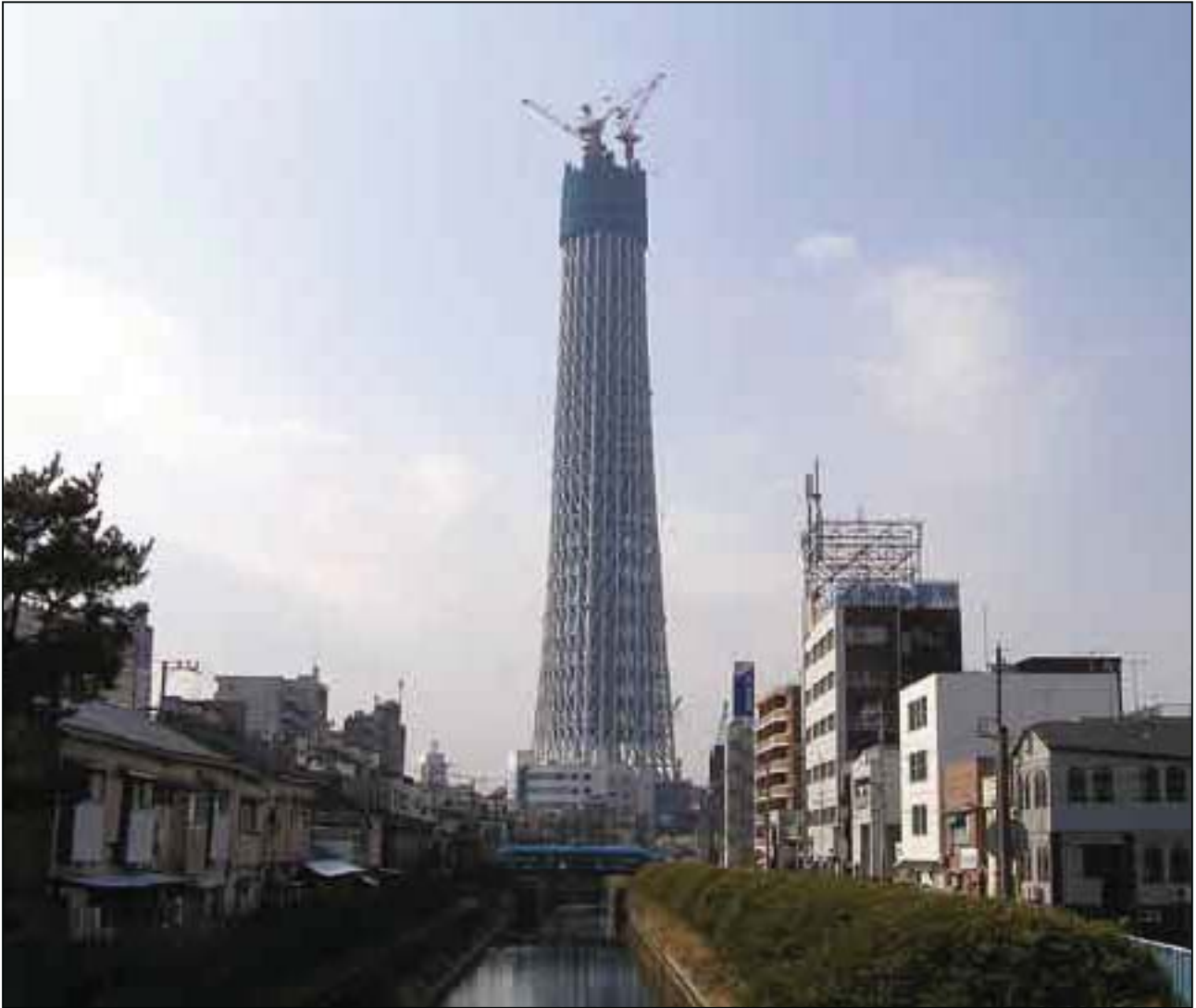
東京スカイツリー建設進捗状況シリーズ

社団法人本所法人会墨田区業平1-7-12 電話(3622)1090 発行者・立岡幸夫 編集・広報委員会春原令一・今井田精司 印刷・合同印刷(株)