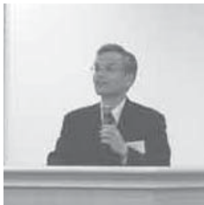
亀井統括官様研修会風景