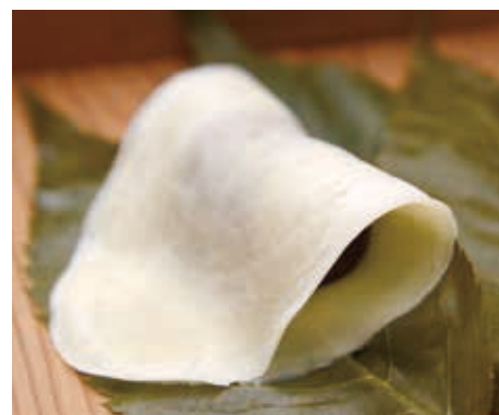
1個200円。店内でいただく場合は「お茶がついて300円」

私どもは1717年の創業です。この300年の間、材料はその時代に手に入るものに変化しているとは思いますが、基本は変わりません。作り方も昔か