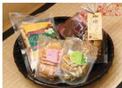
老若男女に人気の商品。手前から時計周り、バジル味216円、トマトチーズ味216円(共にぶちあられシリーズ)、クワトロフォルマッジ350円、チョコヴァッフェル360円、珈琲味216円(ぶちあられシリーズ)

トマトやバジル、最近ではペペロンチーノ味も人気です。今までのあられ屋では見られなかったこれらの味は、経営陣はもちろん、スタッフが考えます。誰か、ということはなく、みんなで何ができるか、アンテナを張っています。もともと、新しいこと、これまでにな