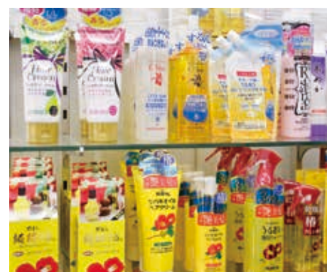
「ツバキオイル」やオリーブオイルを使った「オリーブ園」など約15ブランドを展開

く、油脂販売の会社としてスタート。油を量り売りしていたようです。原料を扱っていることから、事業内容はヘアケア商品のメーカーへ。椿油に特化したのは、二代目にあたる父の発案です。今から25年ほど前ですね。せっかく頭髮によいとされる椿油を使った商品を製造、販売しているのだから、もう少し力を入れてい