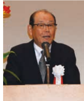
ご挨拶の佐生会長