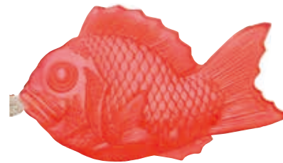
上／玉の肌石鹸の見た目にめでたい WELCOME SOAP。 左／同じくTAMANOHADAシリーズ

自分の感性を信じ生み出した商品なら、絶対にあきらめない。 認めてくれる人は 世界に必ず存在する！