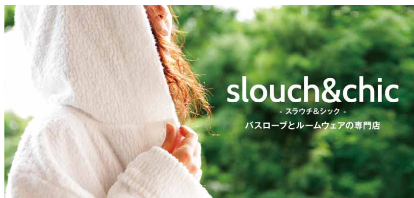
高品質の今治産タオル生地を使ったオリジナルブランド「slouch&chic」

になる頃。当時は兄と比べられることもあり、悔しい思いをしたこともありました。いい思い出ですね。衣料品問屋では同僚と上司の愚痴を言っていたのに、経営者側になり、とまどうこともありま