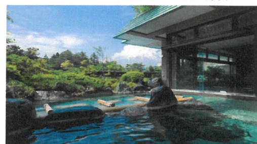
富士山を眺める露天風呂