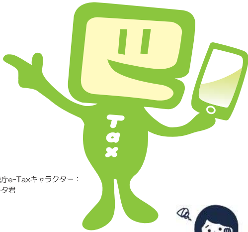
国税庁e-Taxキャラクター：イータ君

国税の場合はe-Tax、地方税の場合はeLTAXを利用して、事前に届出をした預貯金口座からの振替により、簡単な操作で税金を納付することができる便利な電子納税の手段です。